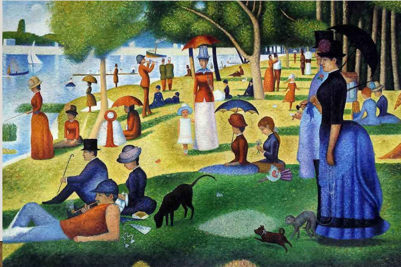
Seurat, Dimanche d'été à la Grande Jatte (1886)