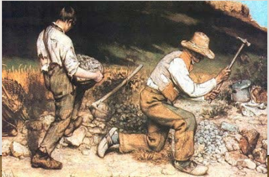
Gustave Courbet 'De steenkloppers' (1849)