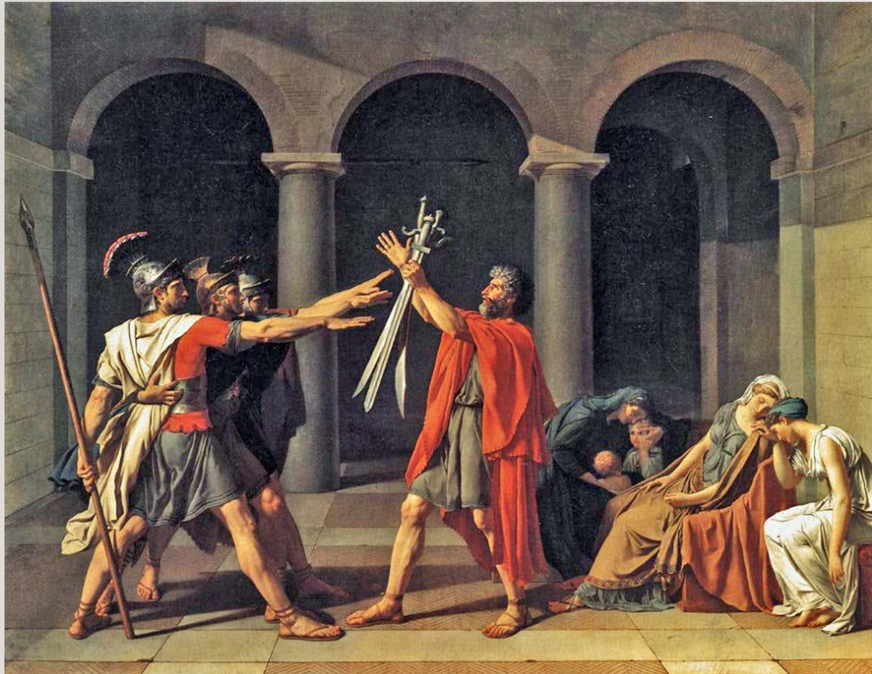
Jaques Louis David de eed der Horatiërs (1784)