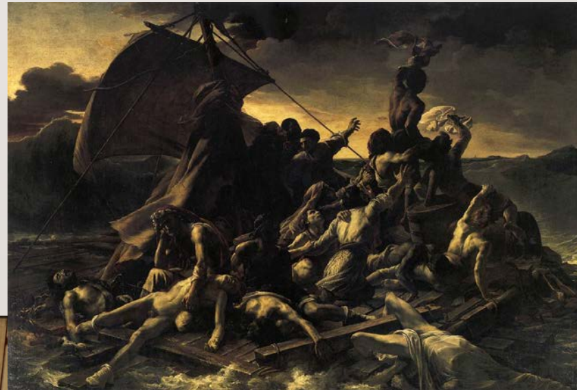
Theodore Gericault, Het Vlot van de Medusa (1819)