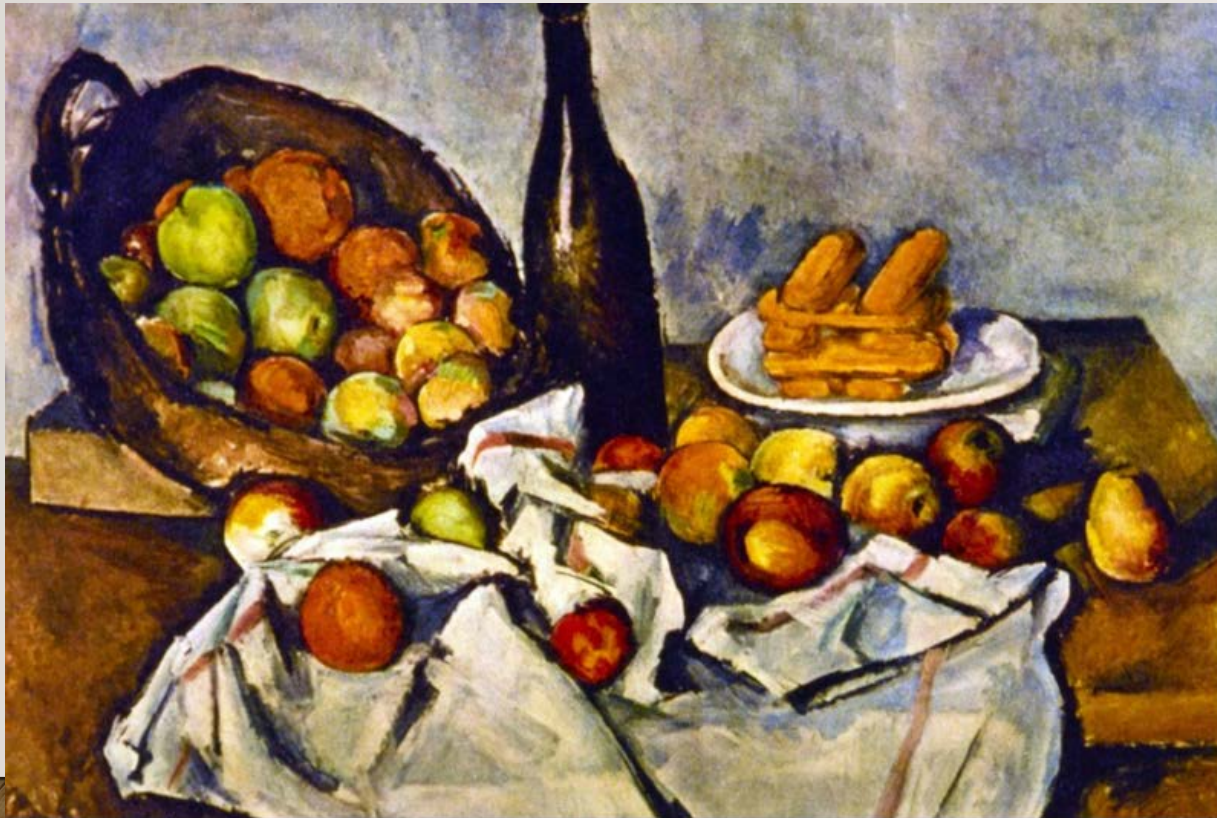
Paul Cezanne, Mand met appelen (1894)