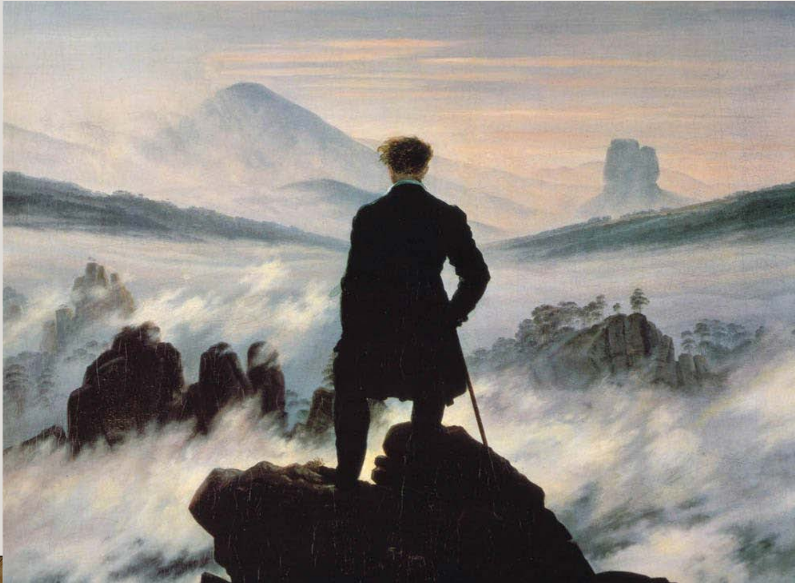
Caspar David Friedrich, Wandelaar boven de nevelen (1817)