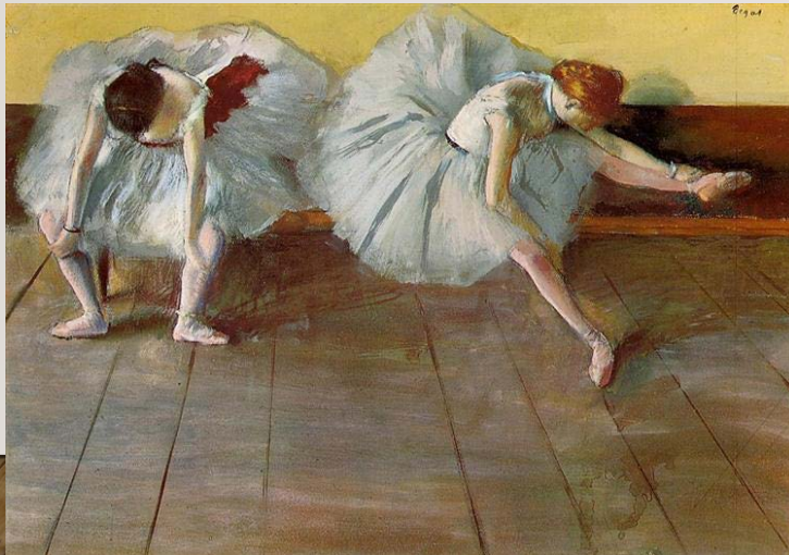
Edgar Degas, Two dancers (1879)