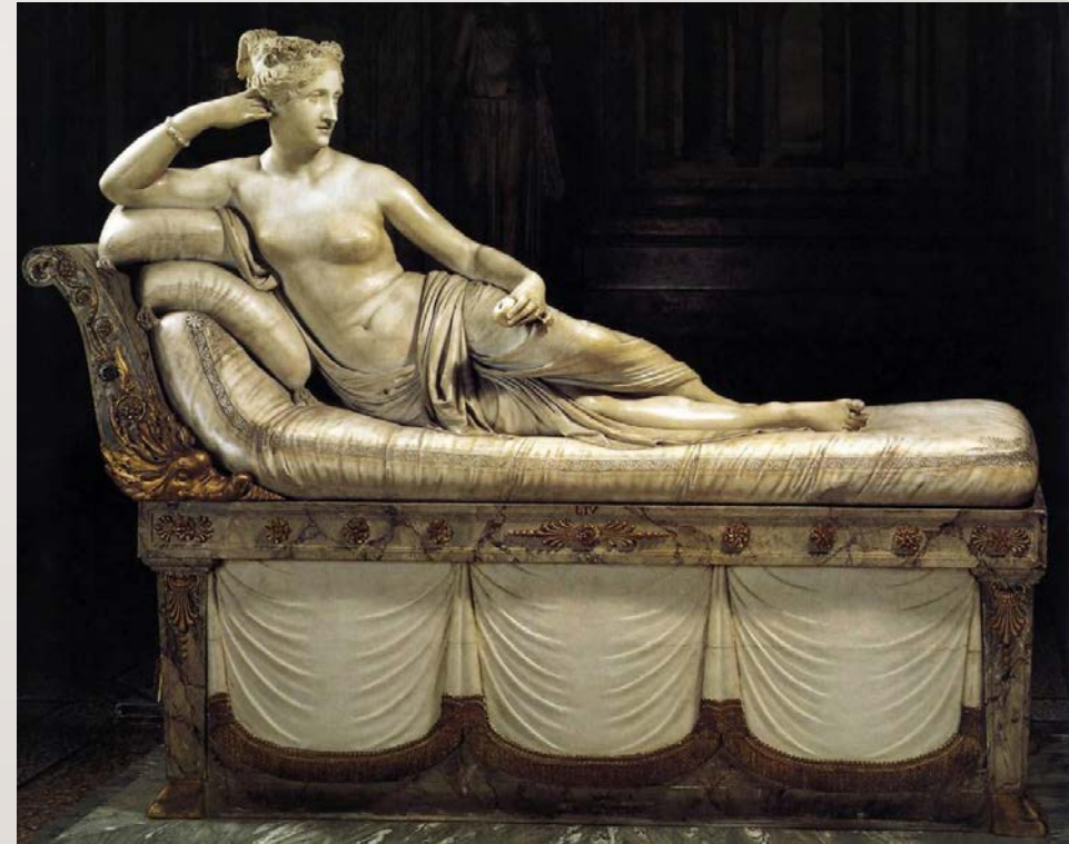
Antonio Canova - Pauline Borghese als Venus Victrix (1808)