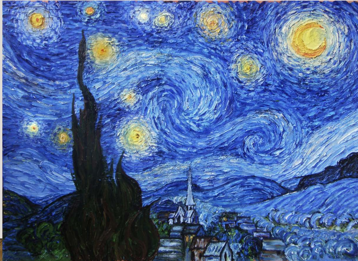
Vincent van Gogh, De sterrennacht (1889)